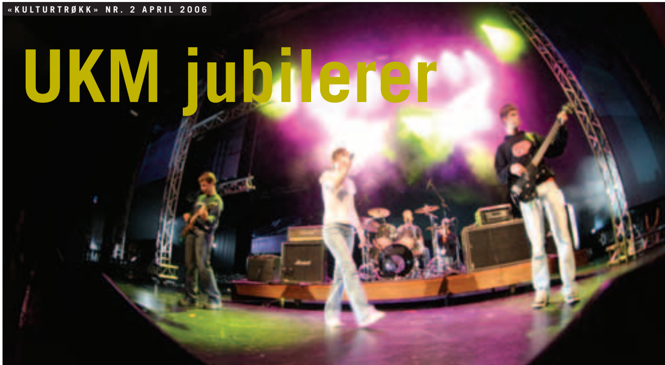
FJØRÅRSDELTAKE: Bandet Dream Combination fra Luster i Sogn og Fjordane deltok i Landsmønstringen 2005.