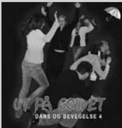
FORMIDLER DANSEGLEDE: Tidens fjerde "Ut på golvet"-cd er på markedet nå.

TRONDHEIM: Det går en dansebølge over landet, og da passer det vel perfekt med en cd skreddersydd for å stimulere til mer dans også blant barn og unge i både grunn- og kulturskoler.