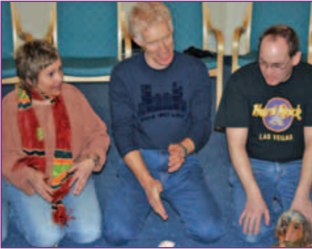
FORTELLERKUNST: Gutta på golvet – og jentene med – jobbet intensivt i fortellerkunstgruppa.