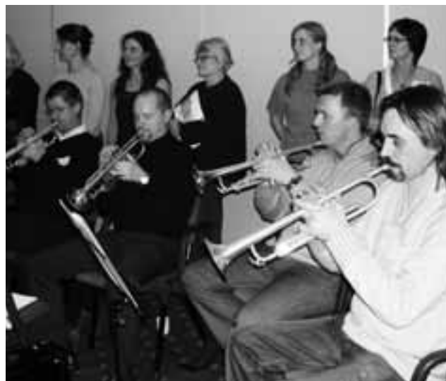
VISNINGSRUNDE: Denne gangen fikk alle deltakerne litt innblikk i de andre faggruppens arbeid på samlinga.