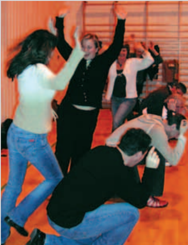
DANSENDE LAGARBEID: Mye talent, energi og entusiasme var i sving under "Gjør det med kroppen!"-seminaret.