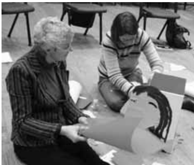
PÅ GOLVPLANET: Pedagoger innen visuelle kunstfag arbeider ofte på golvplanet, også på nettverkssamlinger.