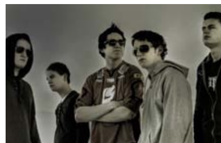
drømmeprodukt: Nordkappbandet Moilrock brukte drømmestipendekronene til å realisere drømmen om egen cd-utgivelse.