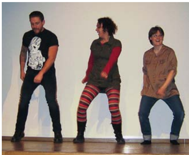
dansende forspill: Deltakerne fra Berlevåg og Båtsfjord hadde ansvar for det musikalske forspillet før festmiddagen, og bød blant annet på dans.