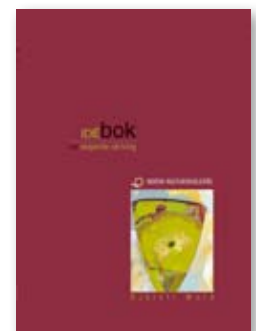
alle får: Samtlige konferansedeltakere får IDÉbok for skapende skriving.