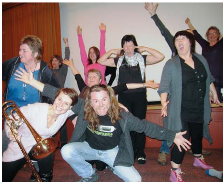
skaperglede: Kulturskolefokus-deltakere i sprudlende utfoldelse på verkstedkurs.