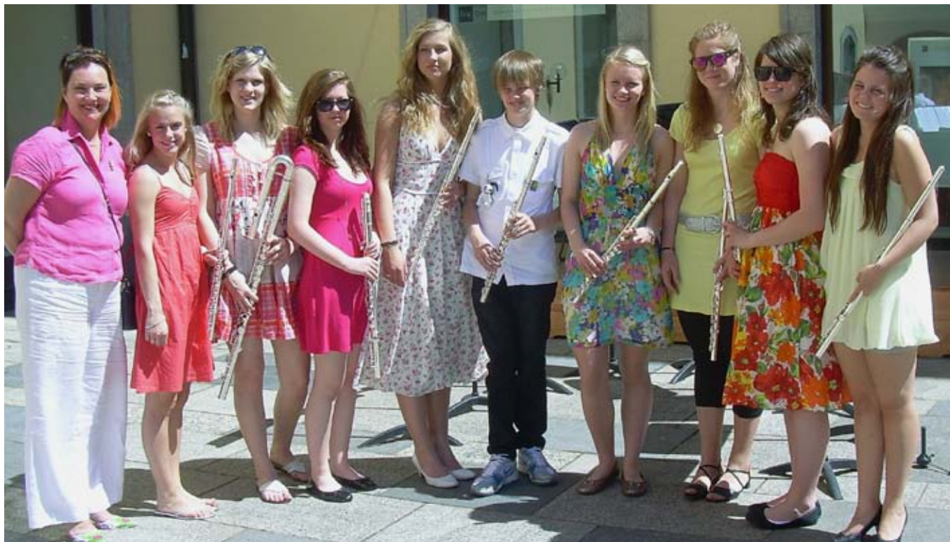
deltok sist: blåsere fra Trondheim kommunale kulturskole var blant deltakerne på forrige Europeiske Ungdomsmusikkfestival, i Linz i Østerrike i 2009.