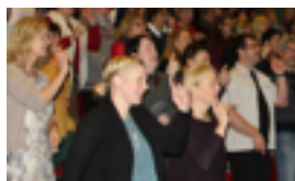
NYE KOR ARTI - KURS MOSJØEN 3. NOVEMBER BODØ 4. NOVEMBER