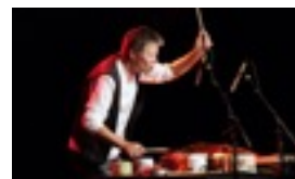
KULTURSKOLE- DAGENE I BODØ 19.OG 20. NOVEMBER