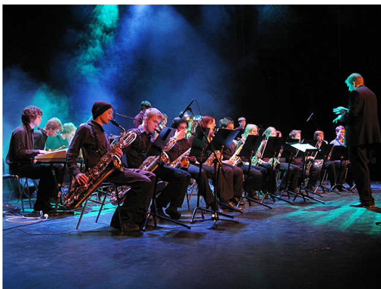
Big Ås Band under Ungdommens kulturmønstring –fylkesmønstringen2005