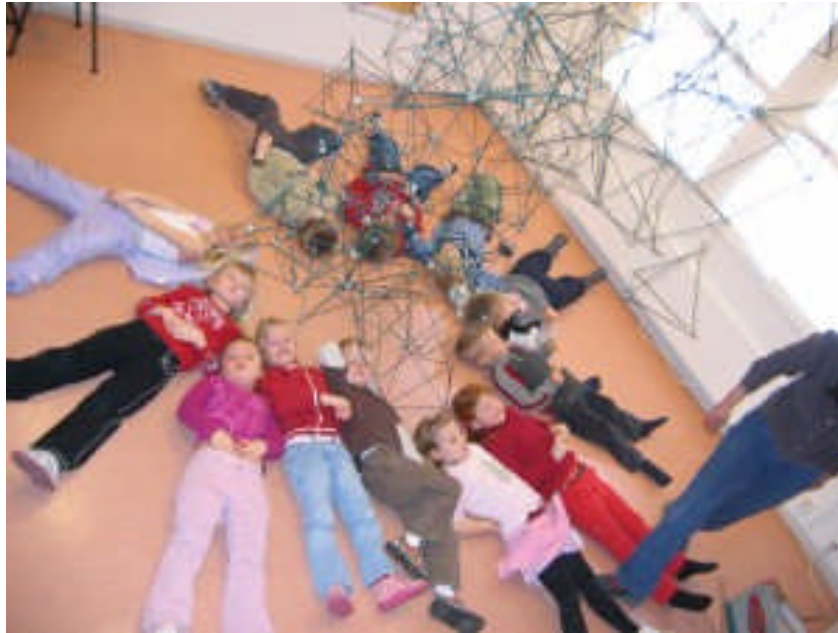
Fra samarbeid med Nordby skole 2005

De to sistnevnte kursene er støttet av utviklingsmidler fra Norsk kulturskoleråd