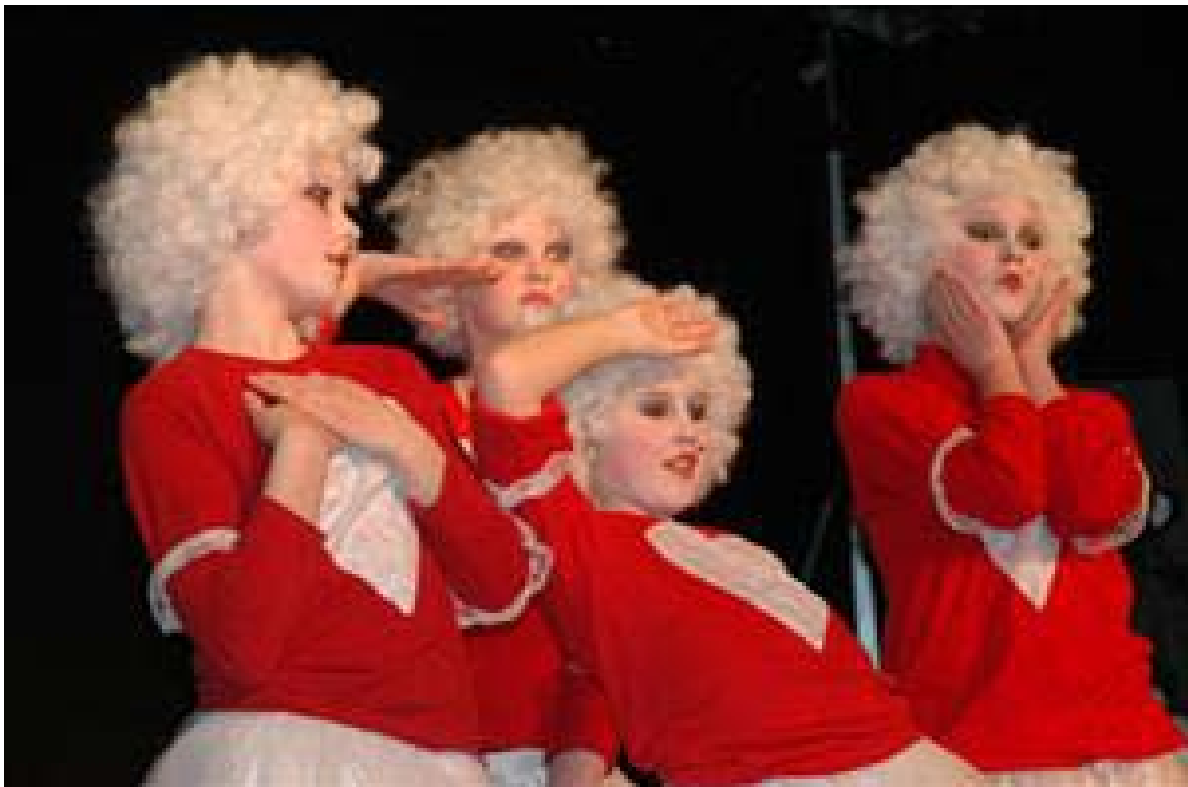
Fra Nord Fosen Kulturskoles oppsetting: Alice lengter tilbake.

Også i DKS og UKM er det behov for samarbeid med engasjerte elever, som ønsker å tilby en tjeneste. DKS sentralt har blant annet etterlyst elevbedrifter som sørger for et godt mottakerapparat når skolene får besøk av ulike kunstnere.