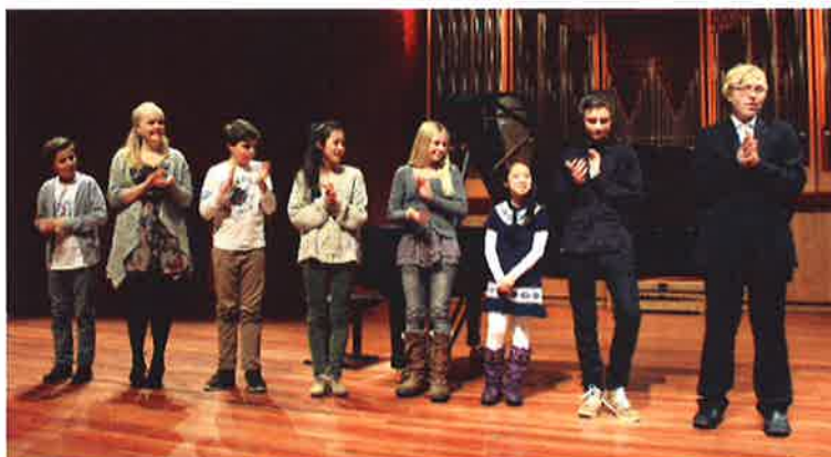
Ungdommens musikkmesterskap 2013