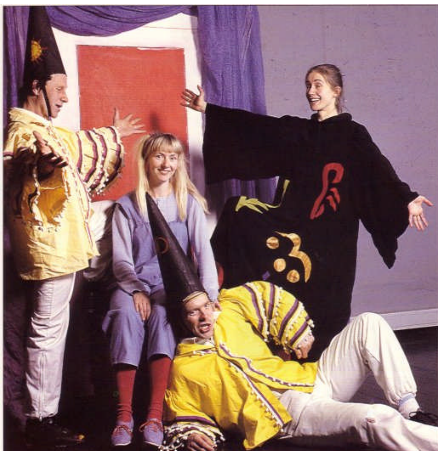
Fra Tynset Dramatens forestilling «Spelmannen» i Sirea.