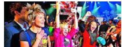
The Black Sheeps