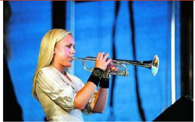
Tine Thing Helseth, trompetist:

– Jeg begynte med gitarundervisning i Lørenskog da jeg var 13 år, og begynte å skrive musikk det samme året. Barn som får utfolde seg innen musikk, dans og drama tidlig, lærer å kjenne følelsen av mestringsfølelse både i seg selv og som del av en gruppe. Spilleglede og kreativ utvikling skaper selvtillit og trygghet som er nyttig å ha med seg videre i livet, uansett.