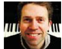
Leif Ove Andsnes, pianist