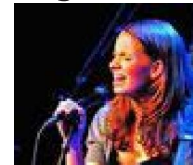
Marit Larsen, artist