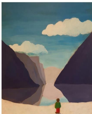
Ullensvang kulturskole - Solomiya Romanyshyn, 14 år.