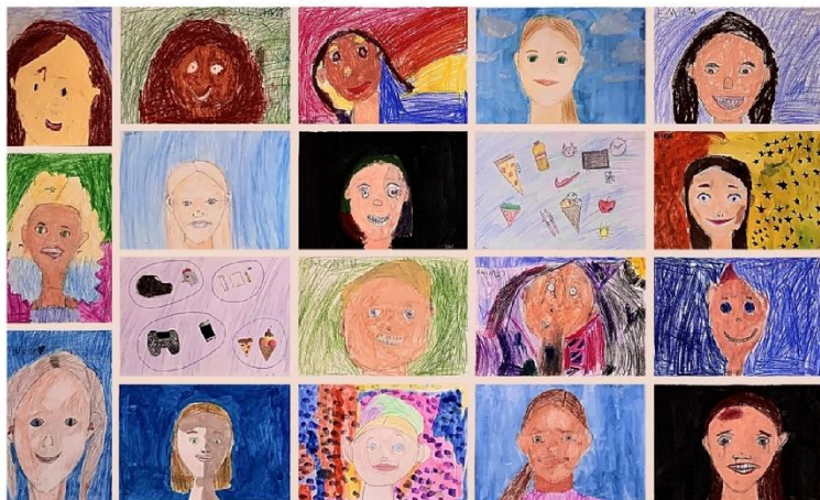
Austevoll kulturskole - Gruppearbeid.