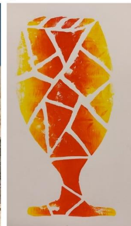
Hyllestad og Fjaler kulturskole - Margrethe Refsnes, 14 år.

Kulturskulekalenderen 2021: Collage av visuelle kunstuttrykk frå elevar i kulturskular frå Vestland fylke.